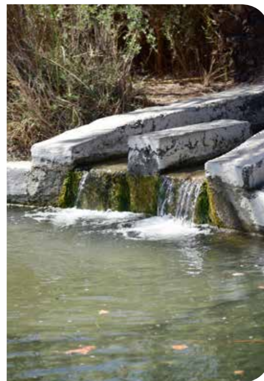
* צילומים משמורת עין בוקק